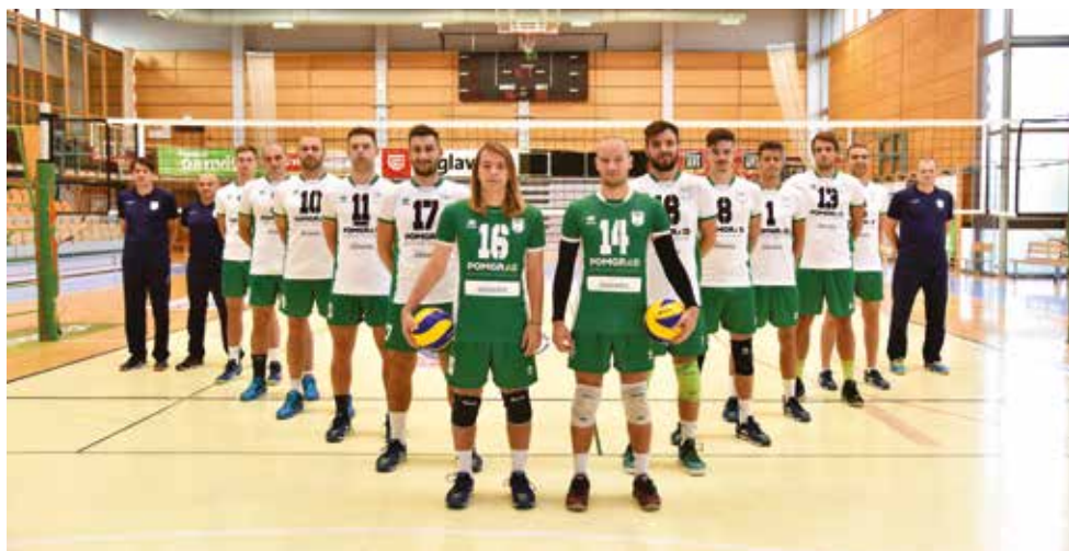
ČLANSKA EKIPA OK PANVITA POMGRAD